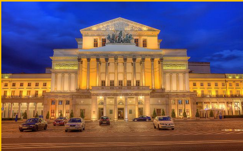
TEATR WIELKI OPERA NARODOWA W WARSZAWIE