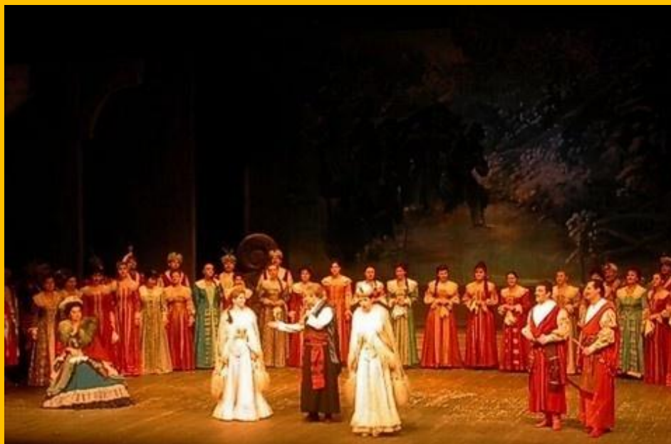
Scena zbiorowa z opery STRASZNY DWÓR Stanisława Moniuszki